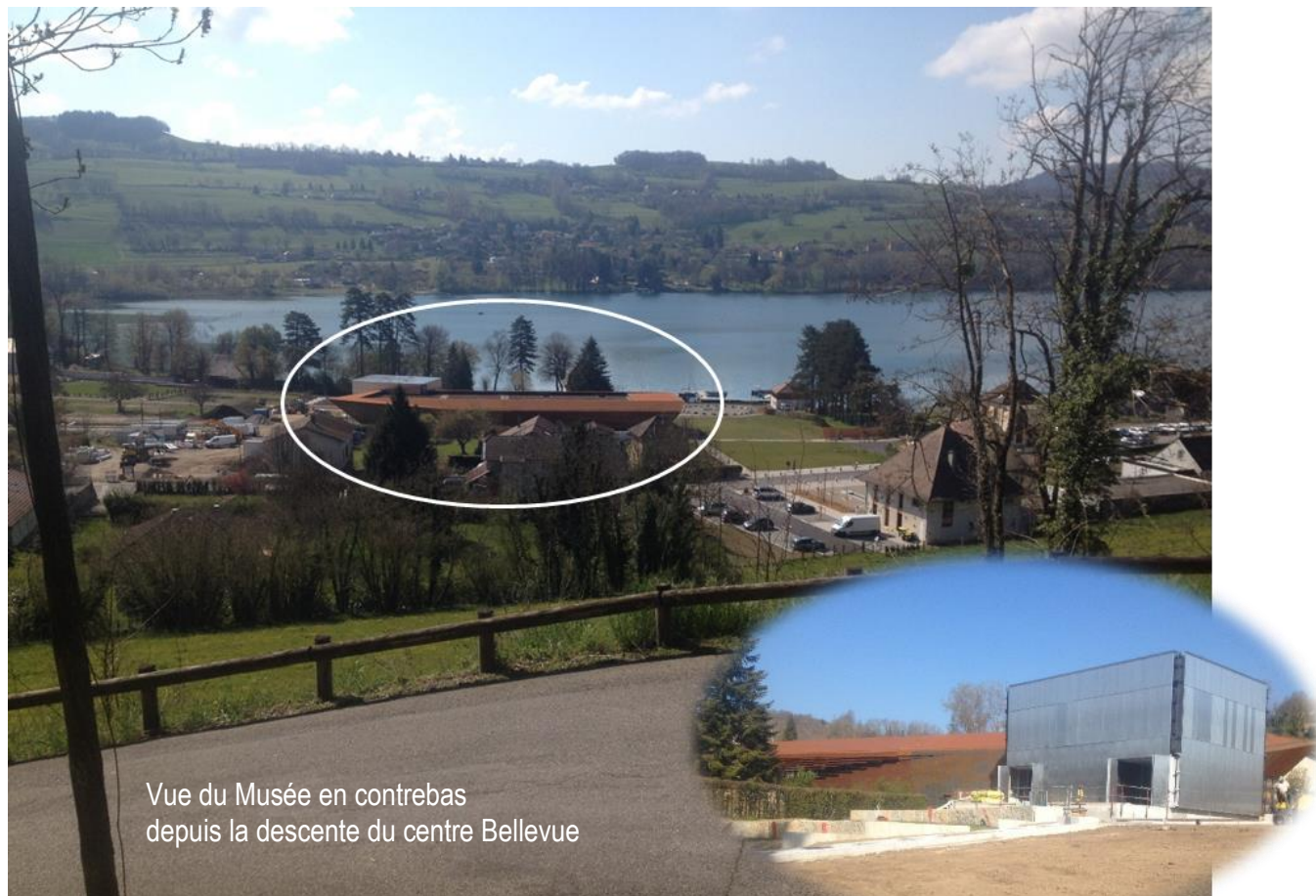
Vue du Musée en contrebas depuis la descente du centre Bellevue

L'ouverture au public du musée devrait ouvrir début 2022.